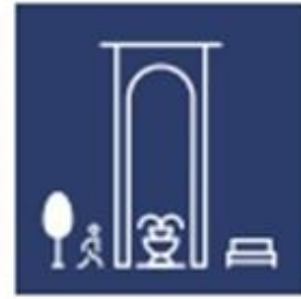
SALFO SUSTAINABLE DEVELOPMENT