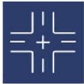
SALFO TRAFFIC AND TRANSPORT