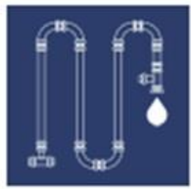
SALFO CIVIL & UTILITIES INFRASTRUCTURE