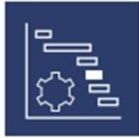
SALFO PROJECT MANAGEMENT