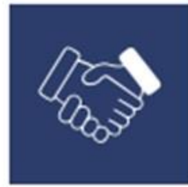
SALFO PUBLIC AND PRIVATE PARTNERSHIPS