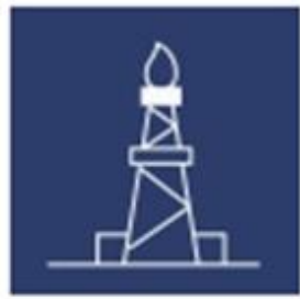
SALFO OIL AND GAS