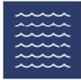
SALFO PORTS AND MARINAS