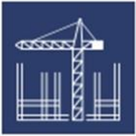
SALFO CONSTRUCTION MANAGEMENT