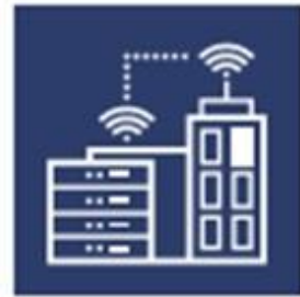
SALFO ICT & SMART CITIES